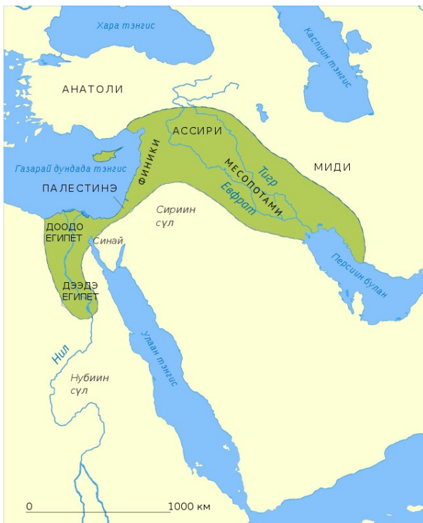
Le croissant fertile

Le Néolithique, ou âge de la pierre polie , fut une période où l'amélioration des conditions de vie des humains permit à la population de considérablement augmenter. Elle s'achève avec la découverte de l'écriture par les Sumériens et les Égyptiens autour de -3300. C'est la fin de la Préhistoire et le début de l'Antiquité.