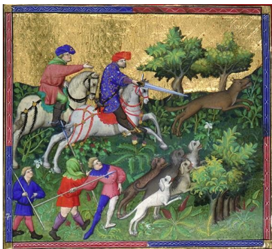
une chasse à courre