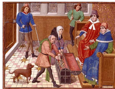
la collecte de l'impôt