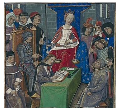
une séance de justice