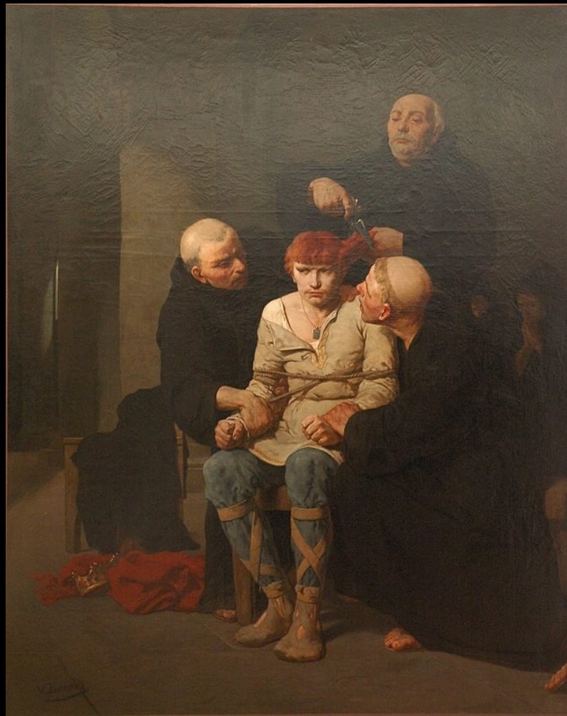
Le dernier des Mérovingiens, Evariste-Vital Luminais, XIXème siècle