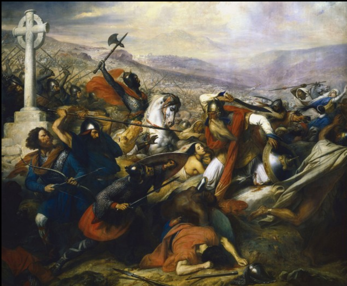
Bataille de Poitiers, Charles de Steuben, 1837