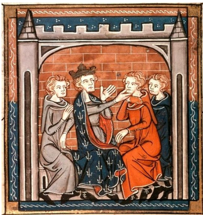
Le roi guérissant les écrouelles par la formule : « Le roi te touche, Dieu te guérit. », Grandes Chroniques de France , XIII ème siècle

Au XIII ème siècle, le roi de France était redevenu le plus puissant des seigneurs du royaume.