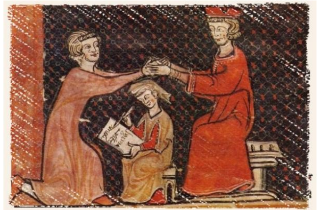
Une cérémonie d'hommage vassalique, Capbreu de Tautavel , XIII ème siècle