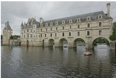
Le château de Chenonceau