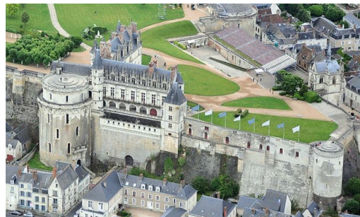
Le château d'Amboise