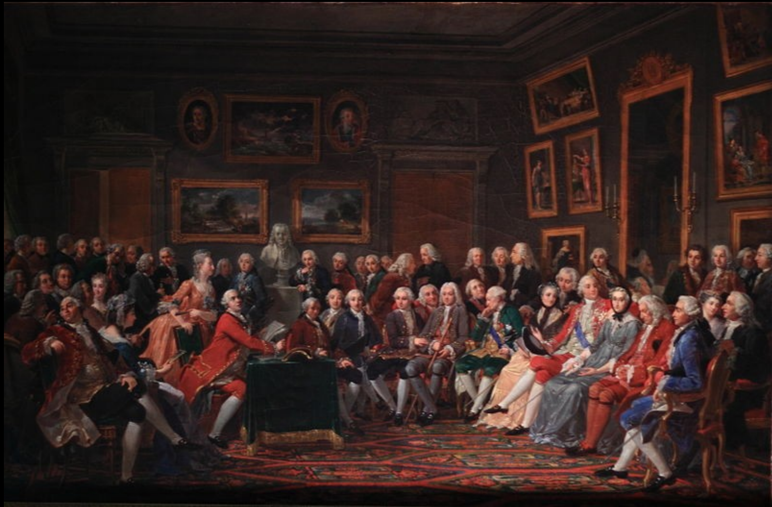
La lecture chez Madame Geoffrin, Anicet Charles Gabriel Lemonnier, 1814-1824