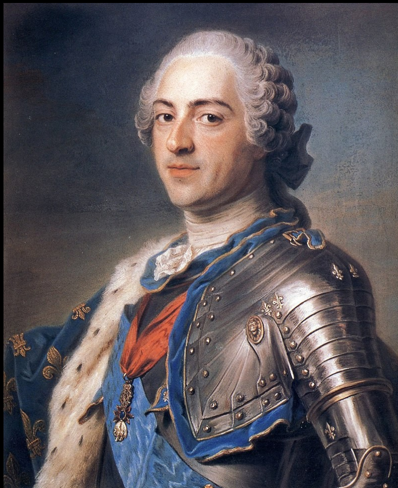
Portrait de Louis XV de France, Maurice Quentin de la Tour, 1748