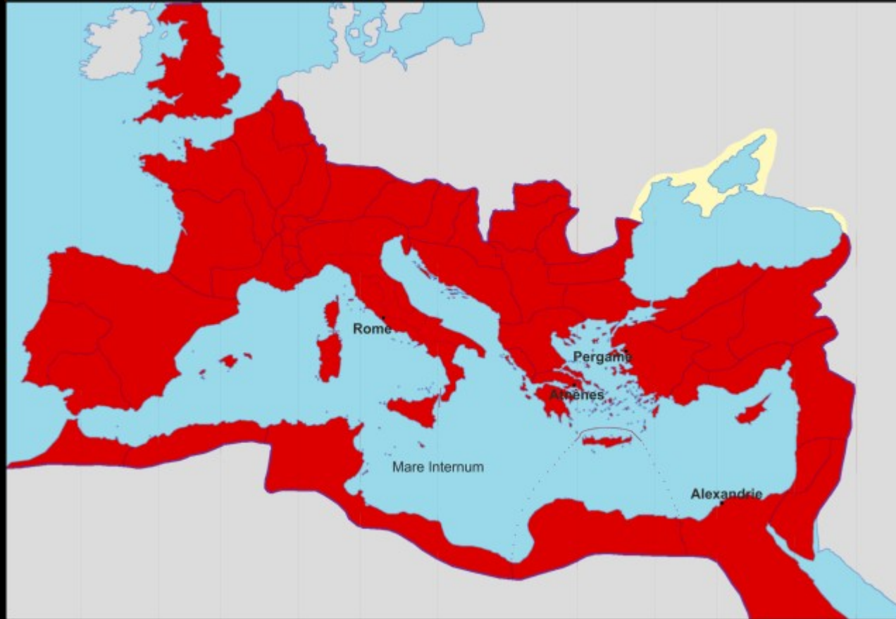
L'empire romain à son apogée, II ème siècle