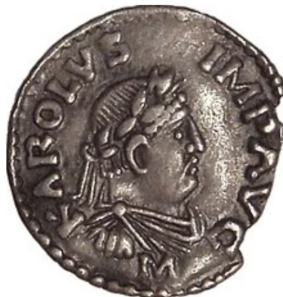
Un denier sous Charlemagne